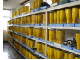
構内立入時は専用長靴着用