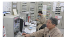
製造工程の集中制御