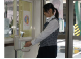
入場者の手指消毒