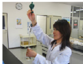
抗菌性飼料添加物検査

製品のトレーサビリティを確立し、原料受入から製品配送までの衛生管理・安全性確認を徹底した、品質管理を行っています。